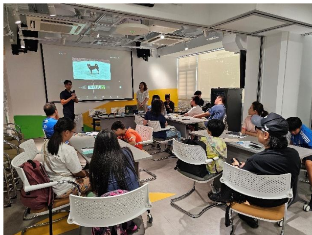
親子故宮園林工作坊