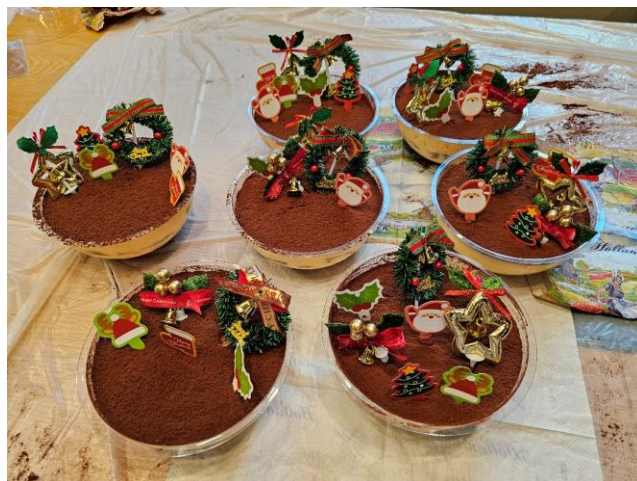
「聖誕心意卡工作坊」暨家長分享小組